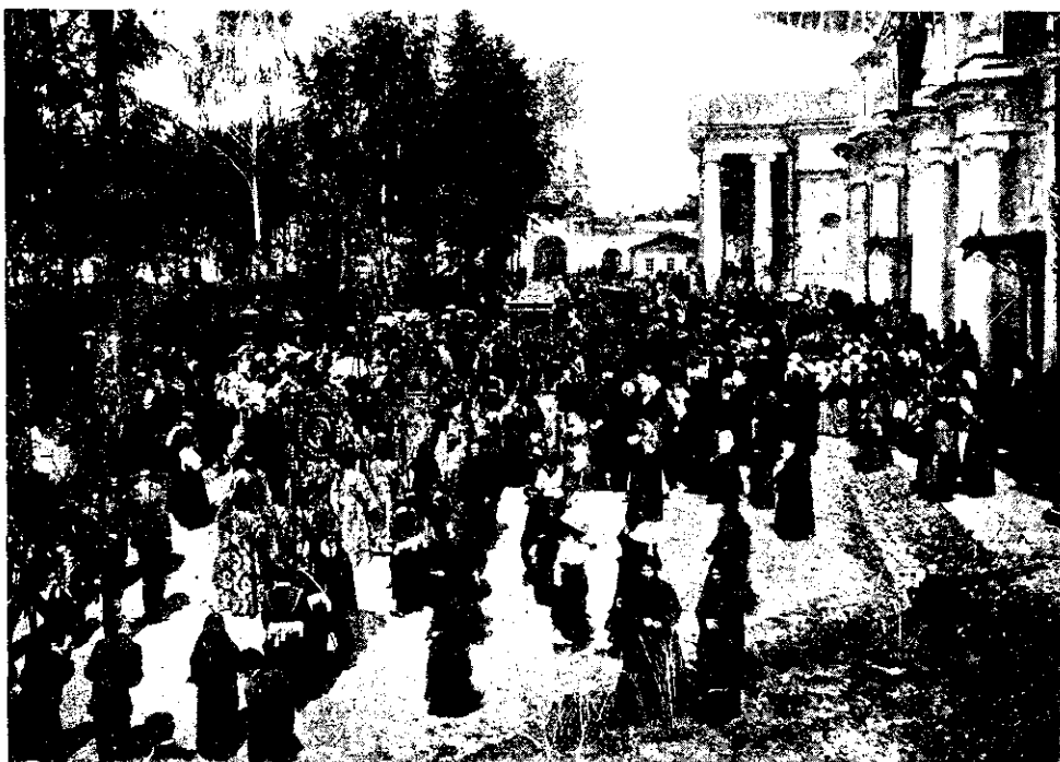
Ежегодное (25 мая) обнесеніе кругомъ обители мощей св. Димитрія Ростовскаго.