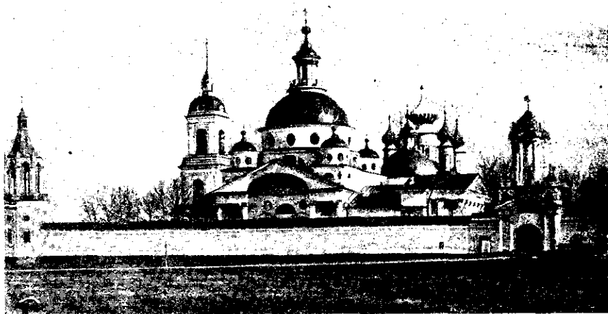
Спасо-Яковлевскій Димитріевскій монастырь въ Ростовѣ-Великомъ.

Чесменской, надъ мощами св. Іакова устроена кованая серебряная (вѣсомъ 7 пуд. 28 фунт., цѣною 9276 руб. сереб.) рака: она имѣетъ видъ продолговатаго четырехъугольника, на бокахъ ея вычеканены судъ св. Іакова надъ кн. Теодорою, чудеса свѣтителя и золочеными буквами написаны краткія свѣдѣнія о его житіи. Близъ юго-западнаго угла храма въ великолѣпной ракъ почиваютъ св. мощи Димитрія, митрополита ростовскаго. Рака — на подобіе гробницы и выкована изъ серебра; на углахъ изображены серебряныи клейма; серебряная крышка снаружи украшена каедрюю, посохомъ, свѣтильникомъ — также изъ серебра и по мѣстамъ убрана чекачюю. Рака обшита внутри малиновымъ бархатомъ, а по краямъ золотымъ позументомъ; въ ней поставлена богато украшенная, изъ краснаго дерева съ серебряными эмалевыми украшеніями гробница, въ коей и почиваютъ мощи св. Димитрія, въ полномъ свѣтительскомъ облаченіи. На главѣ свѣтителя возложена драгоценная митра, пожертвованная гр. Н. Н. Шереметевымъ.