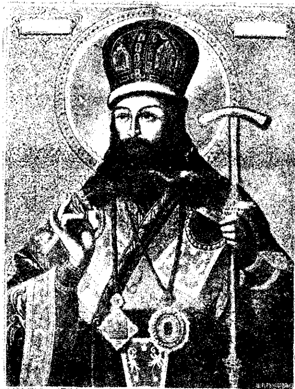
Святитель Димитрій Ростовскій.

Изображеніе взято съ иконы, находящейся въ Ростовскомъ Яковлевскомъ монастырѣ.