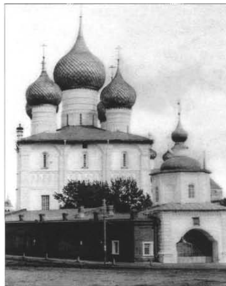
Ростовский Успенский собор. Фрагмент почтовой карточки. Нач. XX в.