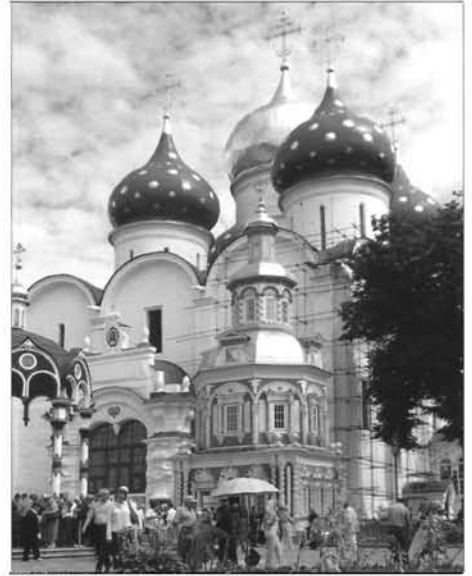
Успенский собор и надкладная часовня. Троице-Сергиева лавра. Современная фотография