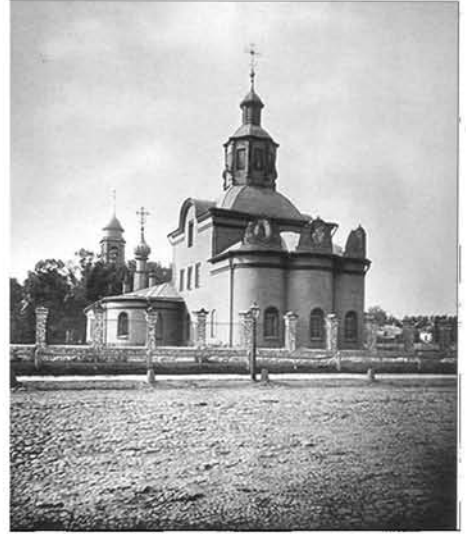
Храм Живоначальной Троицы, что на Капельках, на Мещанской ул. в Москве. Построен в 1693 г. Фотография. Нач. XX в.