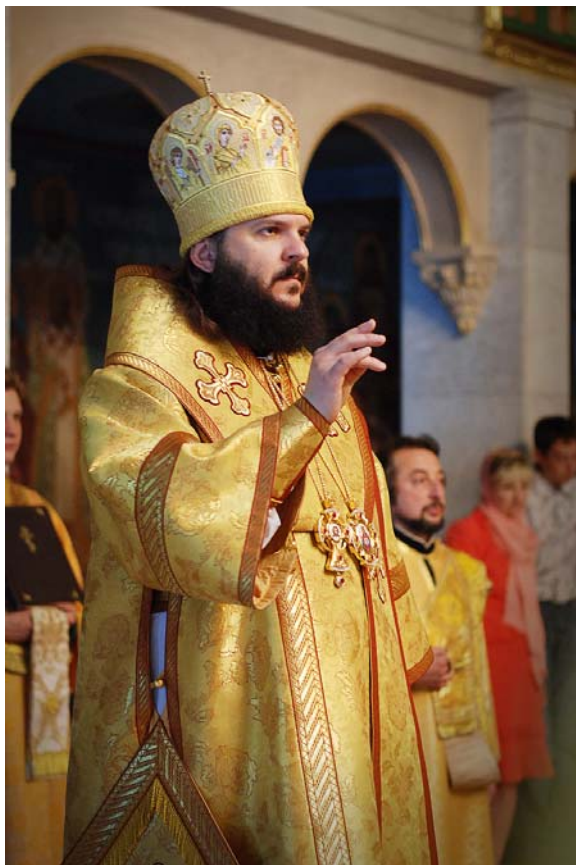
Амвросий (Ермаков), еп. Гатчинский, ректор Санкт-Петербургской Православной Духовной Академии и Семинарии