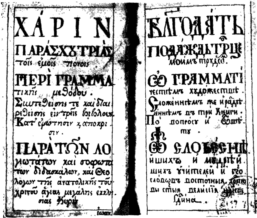
Рукопись Одесской государственной научной библиотеки им. А. М. Горького. Л. 1 об. — 2.