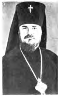
Архиепископ Саратовский и Волгоградский ИМЕН, Архиепископ Черниговский и Пежинский АНТОН, Архиепископ Свердловский и Курганский МЕТИHCСЕДЕК, Архиепископ Астраханский и Енотаевский ФЕОДОСИ