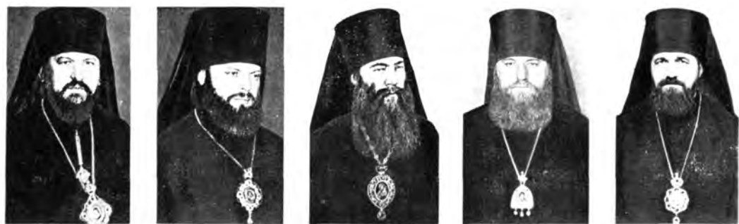
Епископ Пермский и Соликамский АФАНАСИИ. Епископ Алма-Атинский и Казахский ЕВСЕВИИ. Епископ Переяслав-Хмельницкий АНТОНИИ. Епископ Оломоуцкий и Брненский (Православная Церковь в Чехословакии) НИКМОДОР. Епископ Претовский (Православная Церковь в Чехословакии) НИКОЛАИ

Митрополит Ростовский и Новочеркасский ВЛАДИМИР, Патриарший Экзарх Западной Европы. Митрополит Калининский и Кашинский АЛЕКСИИ, Митрополит Рижский и Латвийский ЛЕОНИД. Митрополит Одесский и Херсонский СЕРГИИ