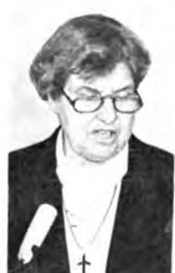
Архиепископ д-р ДОНАЛЬД КОГГАН (Церковь Англии). Генеральный секретарь Всемирного Совета Церквей, пастор д-р ЭМИЛИО КАСТРО. Профессор Эрлангенского университета, ФРГ, доктор ФЭРИ фон ЛИЛИЕНФЕЛЬД