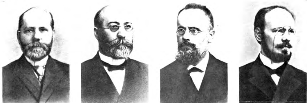
С. П. СОБОЛЕВСКИЙ (1864—1963), С. С. ГЛАГОЛЕВ (1865—1937), А. А. СПАСКИЙ (1866—1916), В. П. МЫШЦЫН (1866—1936).