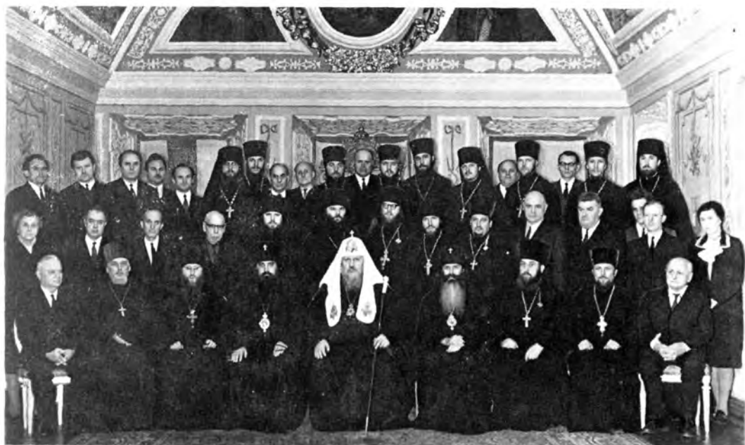
Святейший Патриарх Пимен с профессорами и преподавателями в актовом зале Академии в период ректорства (1966—1973) архиепископа ФИЛАРЕТА (ныне митрополит Минский и Белорусский, председатель Отдела внешних церковных сношений Московского Патриархата)