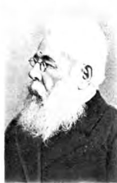
Протоиерей Александр ГОРСКИЙ (1812—1875), Н. И. СУББОТИН (1827—1905), В. Д. КУДРЯВЦЕВ (1828—1891), Е. Е. ГОЛУБИНСКИЙ (1834—1912).