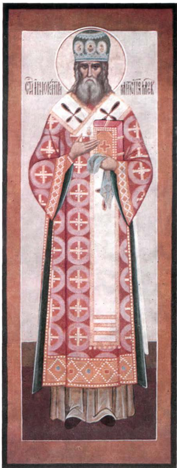
СВЯТИТЕЛЬ МОСКОВСКИЙ МИТРОПОЛИТ ИННОКЕНТИЙ (Вензминов; † 1879). — по благословению которого в 1870 году в Московской Духовной Академии был устроен и освящен храм в честь Покрова Пресвятой Богородицы