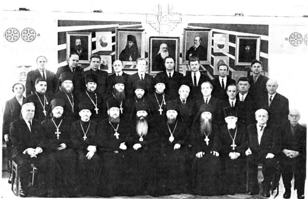
Академическая профессорско-преподавательская корпорация МДА. В центре — ректор (1964—1966) епископ Дмитровский ФИЛАРЕТ (ныне митрополит Киевский и Галицкий, Патриарший Экзарх Украины)