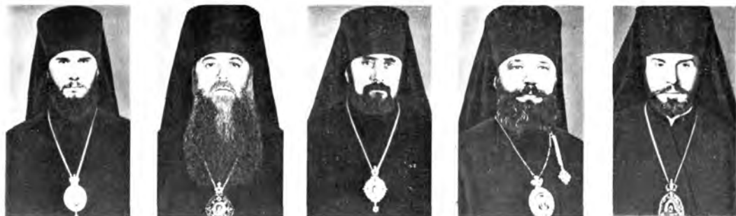
Епископ Серпуховской КЛИМЕНТ, викарий Московской епархии, управляющий приходами Московской Патриархии в Канаде и временно в США. Епископ Звенигородский НИКОЛАИ, викарий Московской епархии, представитель Патриарха Московского и всея Руси при Патриархе Антиохийском и всего Востока. Епископ Подольский ВЛАДИМИР, викарий Московской епархии, настоятель подворья Русской Православной Церкви в Карловых Варах, Чехословакия. Епископ Полтавский и Кременчугский САВВА, Епископ Уфимский и Стерлитамакский АНАТОЛИИ