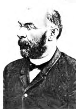
В. О. КЛЮЧЕВСКИЙ (1841—1911), А. Д. БЕЛЯЕВ (1846—1919), Н. Ф. КАПТЕРЕВ (1847—1918), И. А. КОРСУНСКИЙ (1849—1899).