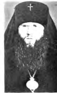
Архиепископ Ивано-Франковский и Коломыйский МАКАРИ, Архиепископ Владимирский и Суздальский СЕРАФИОН, Архиепископ Иркутский и Читинский ХРИЗОСТОМ, Архиепископ Рязанский и Касимовский СИМОН