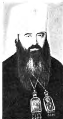
Митрополит Киевский и Галицкий ФИЛАРЕТ, Патриарший Экзарх Украины, Митрополит Ленинградский и Новгородский АЛЕКСИЙ, Митрополит Минский и Белорусский ФИЛАРЕТ, председатель Отдела внешних церковных сношений Московского Патриархата, Митрополит Крутицкий и Коломенский ЮВЕНА III