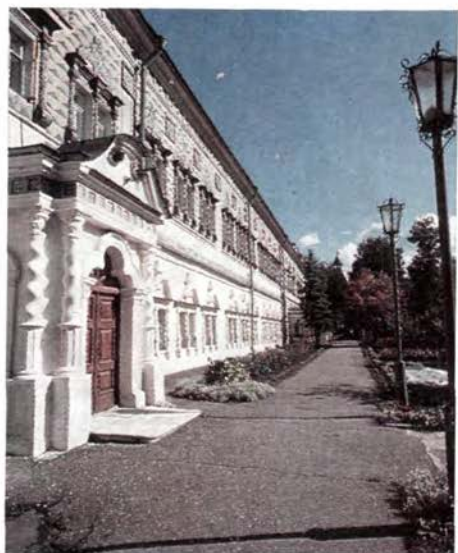
Общий вид Московской Духовной Академии. Фрагмент академического корпуса — «Чертог» (XVIII век). Покровский храм Академии