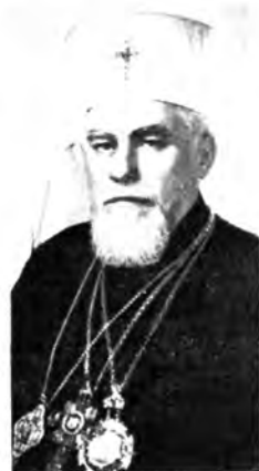
Блаженнейший Патриарх Антиохийский ИГНАТИЙ IV, Святейший и Блаженнейший Католикос-Патриарх всей Грузии ИЛИЯ II, Святейший Патриарх Сербский ГЕРМАН, Святейший Патриарх Болгарский МАРКЪМ