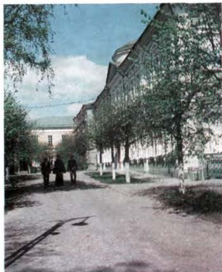
Внутренний вид академического храма в честь Покрова Божией Матери. Здание библиотеки МДА