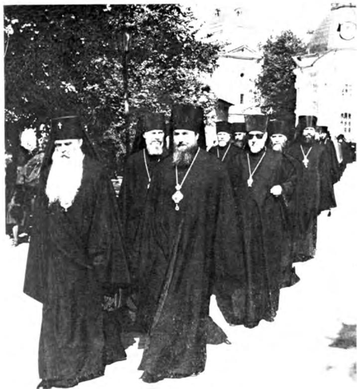
В Большом актовом зале Академии торжественная встреча по случаю начала нового учебного года 1 сентября 1985 года. В первом ряду — почетные гости — представители Эладской Православной Церкви