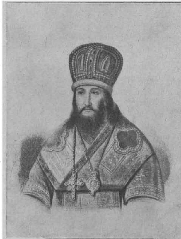
Св. Димитрій Ростовскій.

Прошло нѣсколько дней, но прежняя веселость не возвращалась къ Руѣ. Въ Іерусалимѣ, еще до по-