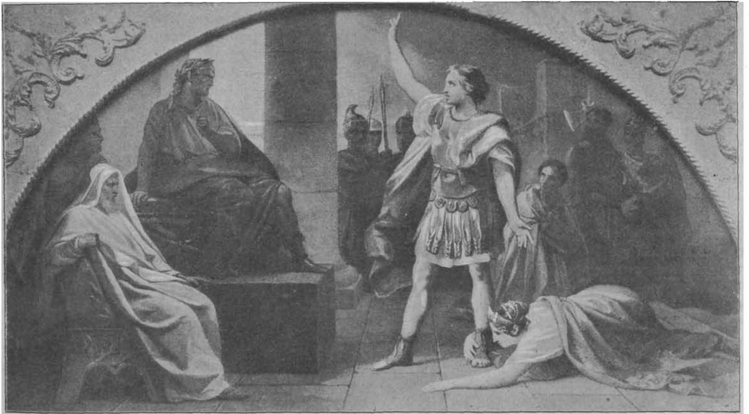
Свв. великомуч. Георгій и муч. царица Александра предъ императоромъ Діоклетіаномъ.

Четьи-Миней отличаются не только прекраснымъ слогомъ и выпуклымъ, картиннымъ изображеніемъ. Въ нихъ чувствуется душа, расширяемая стремленіемъ къ совершенству и жаждущая путемъ примѣ-