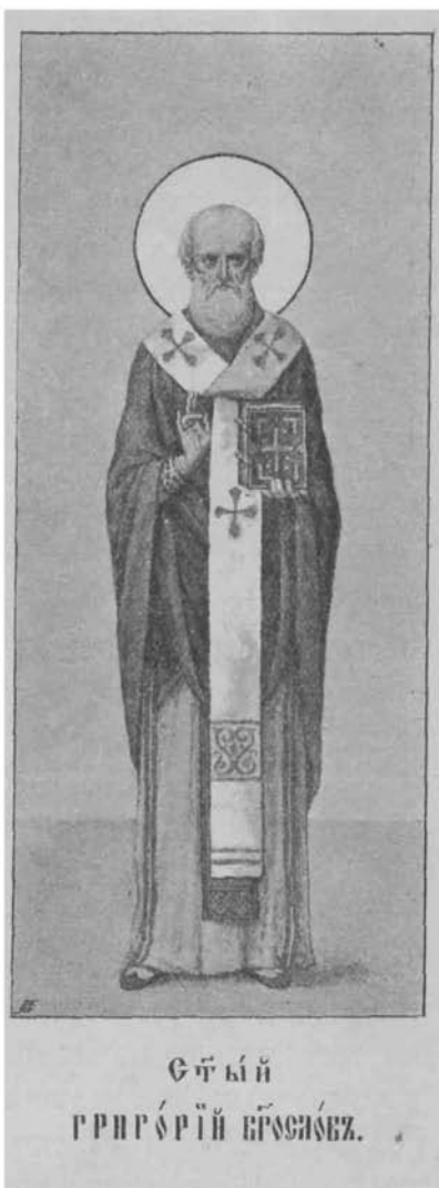
Свѣтлый ГРИГОРІЙ БОГОСЛОВЪ.

Отрокъ воспитывался согласно христіанскимъ обычаямъ. Когда онъ достигъ школьнаго возраста, его тотчасъ начали учить книгамъ. Возрастая годами, Григорій возрасталъ и разумомъ. Въ соотвѣтствіе своему имени 8) , онъ былъ разсудителенъ, бодръ духомъ, усерденъ въ ученіи, и превосходилъ по уму своихъ сверстниковъ. Даже отроческіе годы не служили ему препятствіемъ понимать то,