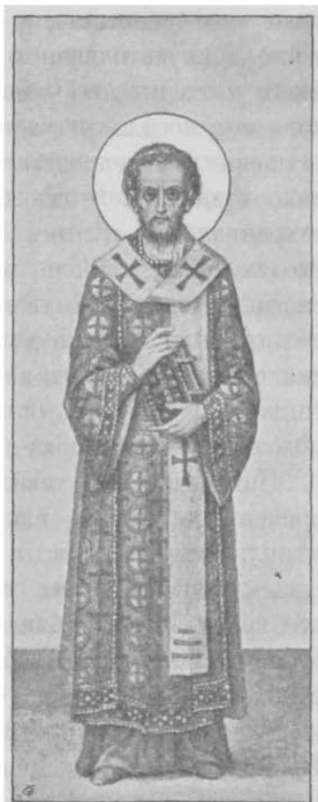
Свѣтій Іоаннъ Златоустый.

—«Чадѣ! недолго меня радовала совмѣстная жизнь съ твоимъ отцемъ, со смертію котораго, по Божественному изволенію, насту-